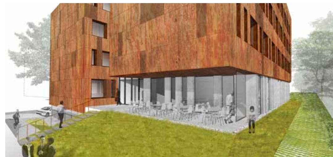
Architectenbureau Styfhals & Partners deelde het gebouw op in twee volumes die het zo positioneerde dat beide volumes een ideale oost-westoriëntatie verkregen.