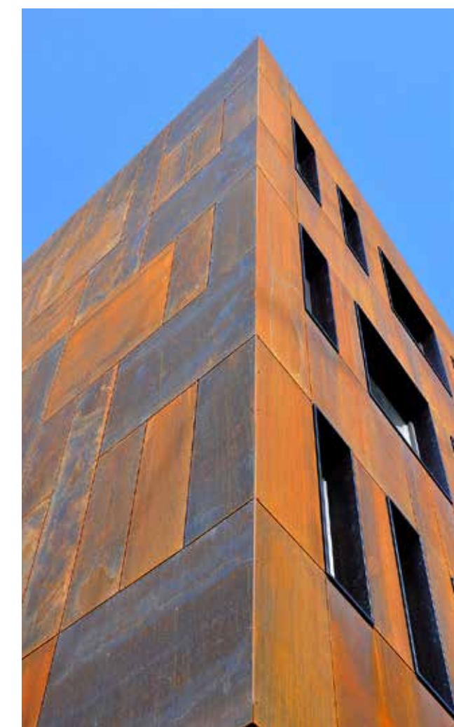
Het gebouw telt in totaal 230 raamkaders.

ISB Ventilatie (Vorst) is met zijn zestig jaar ervaring geen nieuwkomer op de HVAC-markt, maar nieuwe bouwmethodes zoals het passiefbouwprincipe blijven het bedrijf uitdagen. "Een passiefbouw heeft niet alleen invloed op het ontwerp, maar uiteraard ook op de aard van de technische installaties," vertelt algemeen directeur Carl De Vos. "De installatie omvat twee kleine ketels van 60kW, wat zeer weinig is gezien de grootte van het gebouw. Waar vroeger ketels met een vermogen van vijf keer zo groot nodig waren om een gebouw van dergelijke omvang te verwarmen, is het nu mogelijk dit met twee kleine exemplaren te doen, in dit geval door ze te combineren met een luchtgroep van 12.000 m 3 /u, met indirecte adiabatische koeling van GEA Happel." Projectleider Kris Swaelens: "ISB Ventilatie voorzag ook in parkingventilatie en een warmtepomp voor het datalokaal. Voor het gebouwbeheersysteem is geopteerd voor het open systeem van Trend, een merk van systemen dat ISB zelf programmeert, installeert en op de markt verdeelt. Het sanitaire gedeelte omvatte de installatie van de nodige douches, toiletten, haspels en regenwaterafvoer voor het 3.700 m 3 grote gebouw."