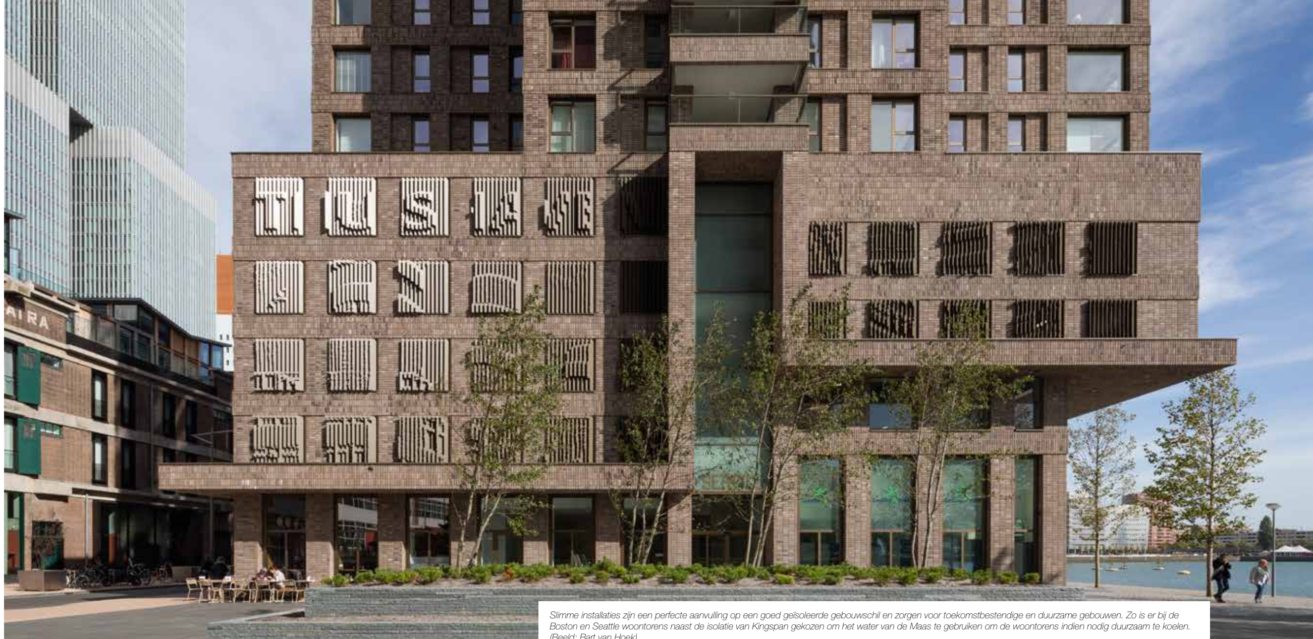
Slimme installaties zijn een perfecte aanvulling op een goed geïsoleerde gebouwschil en zorgen voor toekomstbestendige en duurzame gebouwen. Zo is er bij de Boston en Seattle woontorens naast de isolatie van Kingspan gekozen om het water van de Maas te gebruiken om de woontorens indien nodig duurzaam te koelen.

Tekst: Susan Peek