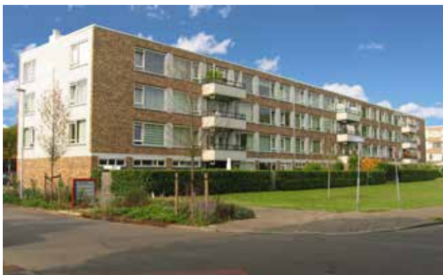
Niet alleen is Kooltherm isolatie een hele duurzame keuze qua materiaal, maar het biedt ook financiële voordelen. Zo konden bij dit project in Utrecht ruim 800 portiekwoningen overgaan van energielabel E of F naar energielabel A op de bestaande fundering.

'Duurzaamheid: één van onze speerpunten'