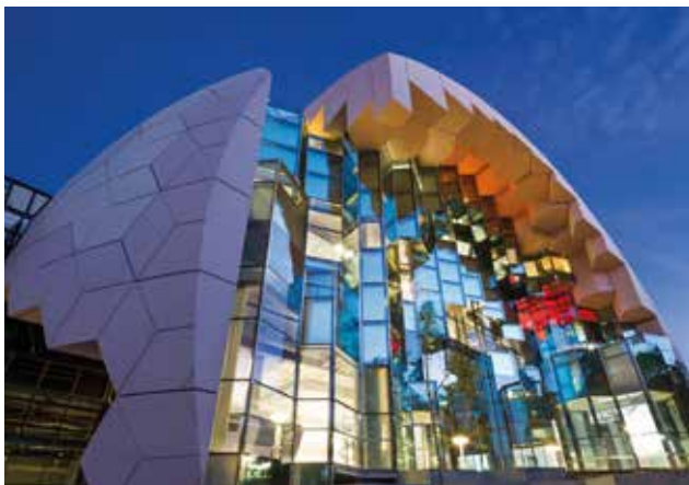
Duurzaamheid was één van de speerpunten voor de bouw van de Geelong Bibliotheek, waarbij de keuze is gevallen op de Kooltherm K12 Frameplaat en de Kooltherm K10 Plafondplaat.

De isolatiematerialen nemen minder ruimte in bij transport, wat weer financiële en milieukundige voordelen oplevert.